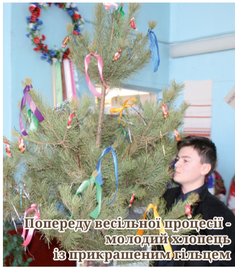
Попереду весільної процесії - молодий хлопець із прикрашеним гіллям

Гарненькі дівчатка у вишиванках зустрічали гостей, як годиться, старанно вивченими словами: «Просили батько, просили мати, і я вас прошу до нас на весілля». Зала, прикрашена старовинними і сучасними вишитими рушниками, ледь