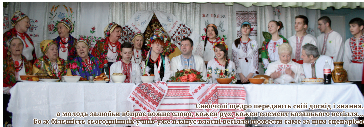
Сивочолі щедро передають свій досвід і знання, а молоді залюбки вбирає кожне слово, кожен рух, кожен елемент козацького весілля... Бо ж більшість сьогоднішніх учнів уже планує власні весілля провести саме за цим сценарієм

- Готуючись до цього заходу, колектив нашого клубу став ще дружнішим та згуртованішим. Ми ніби відтворювали весілля, характерне для малесенького регіону України, але водночас вкотре пройнялися великою любов'ю до своєї рідної землі, яка зрощує працюючих і талановитих людей. У такий спосіб ми спробували відкрити ще один фронт боротьби за Україну, бо той, хто прагне відібрати в нас територію, ставить за мету знищити і розчавити наші традиції, звичаї, нашу культуру. Проте, ставши в один ряд із сивочолими і досвідченими, учні моєї рідної школи продемонстрували шану і повагу до всього українського і, в першу чергу, - до народних обрядів.