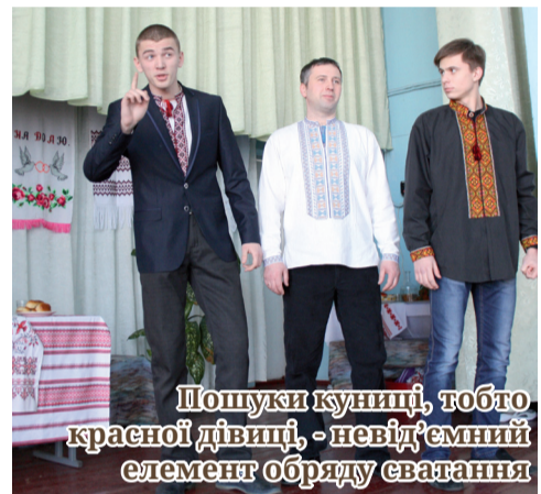
Пошуки куніці, тобто красної дівчиці, - невід'ємний елемент обряду сватання

Пісні, елементи одягу, традиційний реквізит з покоління в покоління передавалися знавцями весільних обрядів. Та новий вік диктує нові закони. І все більше весілля проводиться «як у кіно» - красиво, вишукано, по-європейськи. Маєш гроші - спеціально запрошений розпорядник підготує все так, щоб створити весільну казку. Таку ж блискучу, феєричну, але, водночас,