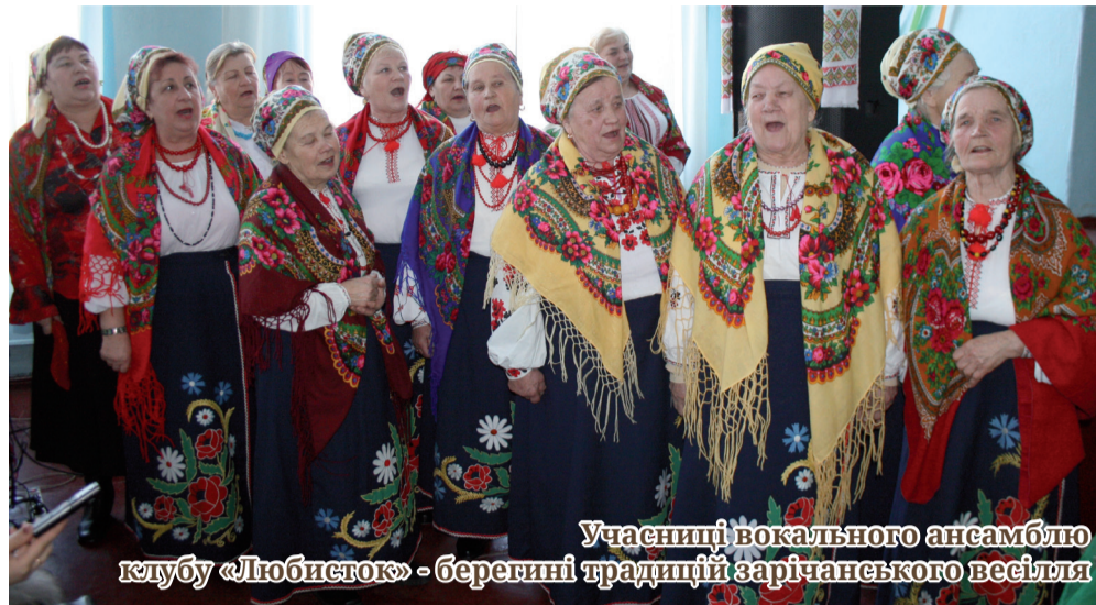
Учасниці вокального ансамблю клубу «Любисток» - беруть традиції зарічанського весілля

Захоплені цікавим видовищем, красивими піснями і щирою грою артистів «з народу», глядачі й не помітили, як стали повноправними учасниками дійства. Кожного охочого дужі хлопці гойдали на рядні, гарненькі циганочки долю віщували, ряджені, перевдягнуті за