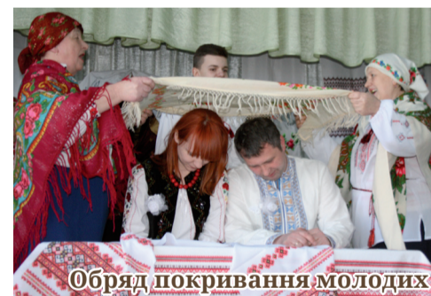
Обряд покривання молодих

Ви запитаете, навіщо все це? Навіщо в такий важкий час, коли більшість переживає як душевну печаль, так і матеріальну скруту влаштувати такі гучні вистави? А хіба збереження традицій, виховання патріотизму в молодих поколіннях потрібно підлаштовувати під події?