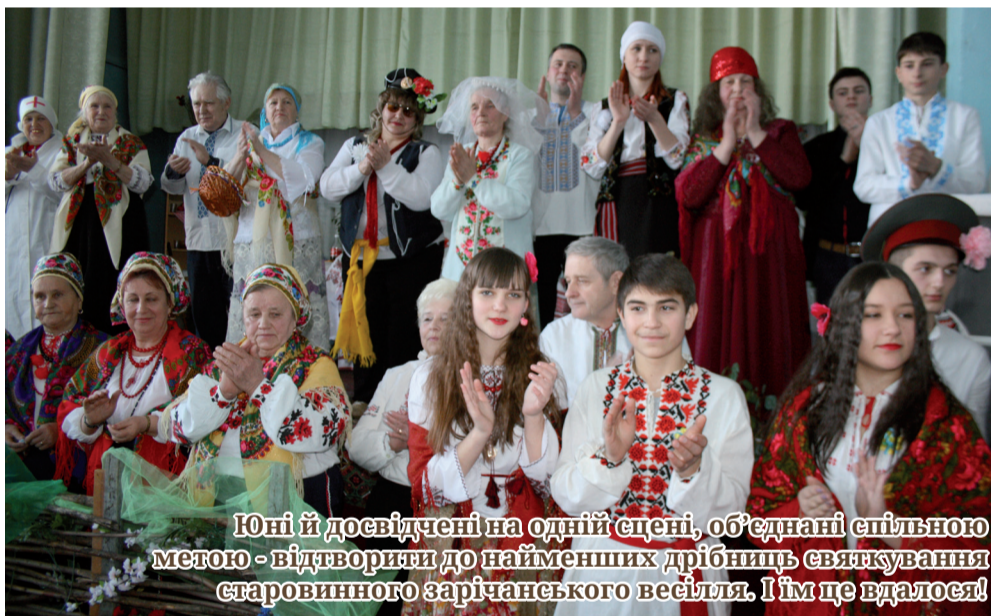
Юні й досвідчені на одній сцені, об'єднані єдиною метою - відтворити до найменших дрібниць святкування старовинного зарічанського весілля. І їм це вдалося!

вміщала всіх охочих подивитися на дійство. Упродовж півтори години перед глядачами пролетіли всі 5-7 днів традиційного святкування. Залицяння молоді, сватання, повернення молодих з церкви, весілля в домі нареченої, ведення молодої до дому молодого, знімання вінка, «продаж»