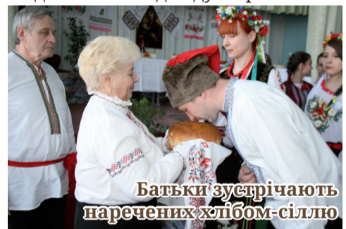
Батьки зустрічають наречених хлібом-сіллю

Показати «молодим та зеленим» всю повноту, красу та неповторність справжнього зарічанського весілля наважилися члени клубу «Любисток». Хоча це рішення далось їм нелегко. Бо ж і природна скромність показати себе не дозволяє, та і поєднати в одній виставі два дуже різні світи