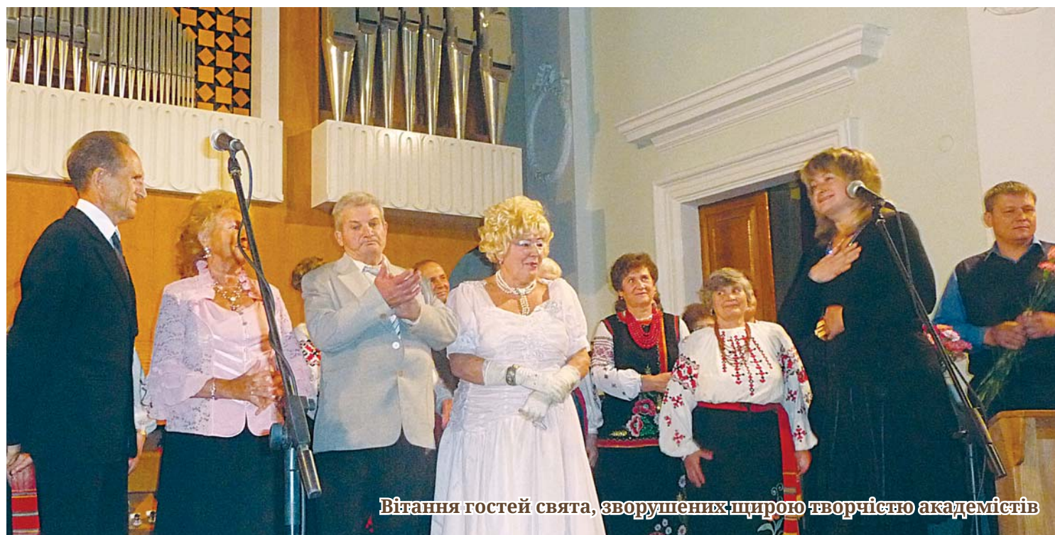
Вітання гостей свята, зворушених щирою творчістю академістів

Усі учасники концерту отримали від Благодійного фонду Костянтина Єфименка солодкі подарунки і квіти, але найбільшою нагородою для кожного з них була можливість виявити власний талант і з великої сцени подарувати свою творчість людям.